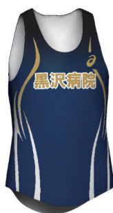
新調したオリジナルウェア