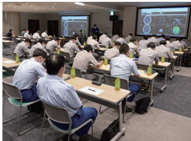
事前に救急隊より多くの質問をいただいております