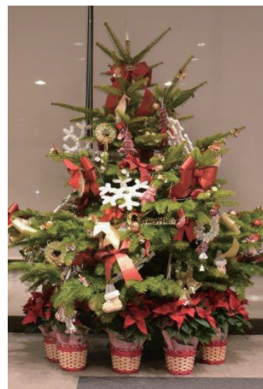
受付前のクリスマスツリー