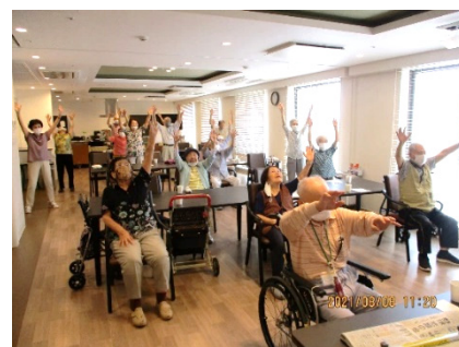
毎日の体操 (午前中に各フロアで実施)

人生には様々あり、考え方もそれぞれ違いますが、CVK は、PPK (ピンピンコロリ) で最期を迎えるのは幸せの形の1つと考えています。ず〜っと楽しく元気に生活し、寝込むのは2週間くらい。この位の時間が取れば、ご家族様の心の整理もつきますし、遠方の親族の方にも会うことができます。また、ご家族の負担もあまりかからず、何よりご本人様も長く苦しまない。ですので、CVK はご入居者様に楽しく元気に過ごしていただきたいと考えています。ホームに入ったら、あまり楽しみがない。のではなく、ホーム入居したからこそ楽しみが増えた。そう言っただけのよう様々な取組みをおこなっています。