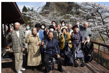
外出イベント (妙義山にて花見)