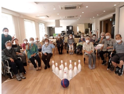
毎日のレク (ボウリング終了後の1枚)