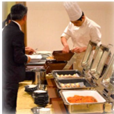
ビュッフェスタイル