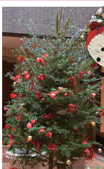
中庭のクリスマスツリー