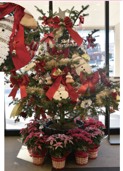
黒沢病院受付前のクリスマスツリー