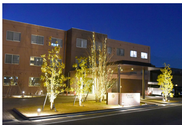
カーサ・デ・ヴェルデ黒沢のイルミネーション