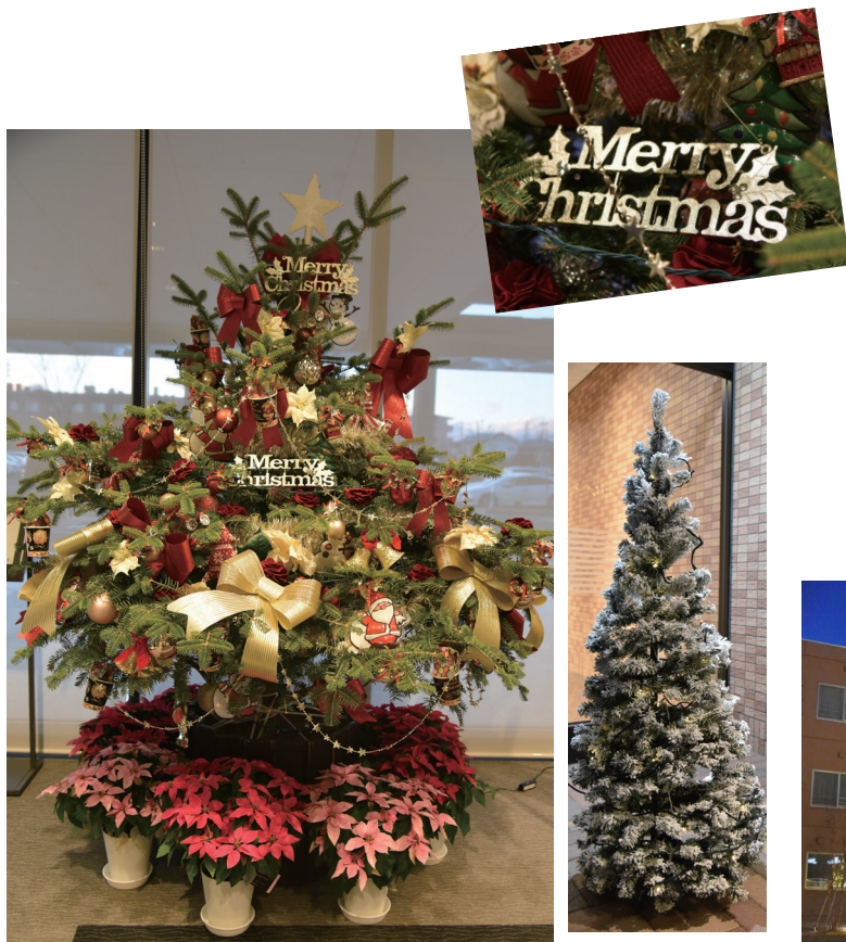
黒沢病院受付前のクリスマスツリー

今年は新型コロナウイルス感染症対策の為、多くのイベントを中止せざるを得ない状況でした。11月24日より院内2か所にクリスマスツリーを飾りました。また、12月1日より敷地内にイルミネーションを設置し、少しでも地域の方々の気持ちが明るくなればという思いを込めて毎日点灯しております。