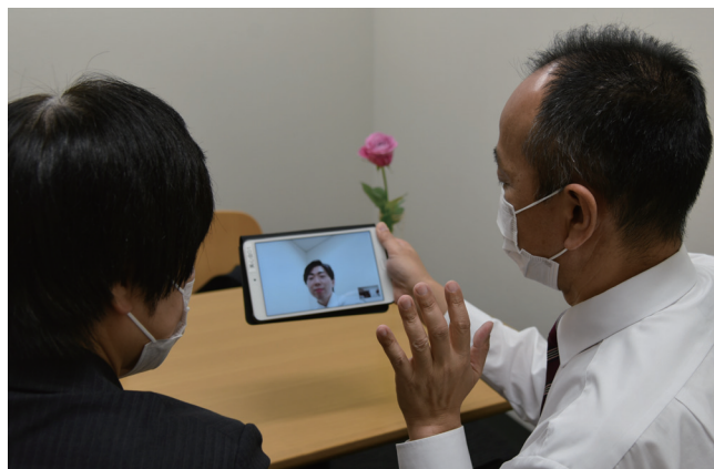
オンライン面会をしている様子